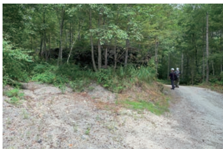
写真-2 中堀沢に設置されたふとんかごによる導流堤