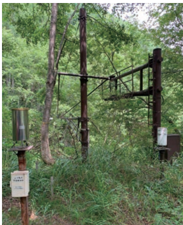
写真-4 上々堀沢右岸の観測機器 (雨量計、超音波式水位計、CCTVカメラ等が設置されている。)