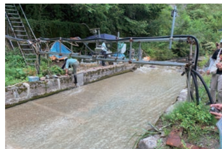
写真-7 足洗谷観測水路 (水路床にはパイプ型ハイドロフォン、プレート型ハイドロフォン、ピット流砂観測装置等が設置されている。)