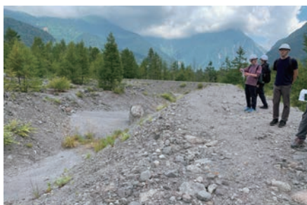
写真-3 上堀沢に作られた土石流減勢工