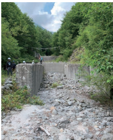
写真-5 上々堀沢に設置された底面水抜きスクリーン工およびリングネットを固定するための吊索 (現在スクリーンは撤去されている。)