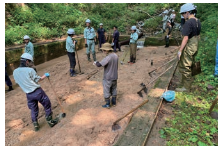
写真-6 ヒル谷試験堰堤での排砂の様子 (鍬やスコップ等を使い手作業で土砂を下流に流していく。)