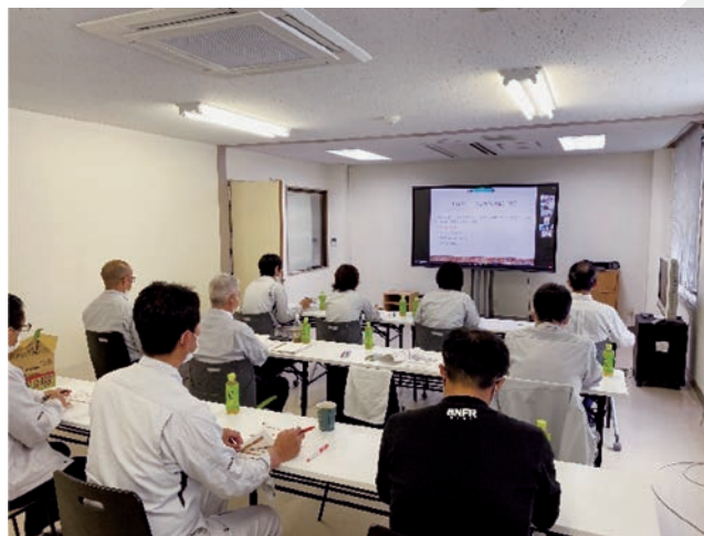
WEBによる研修実施状況（(株)サン環境計画様ご提供）