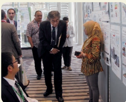
インタープリバントでのポスターによる自国の土砂災害の紹介