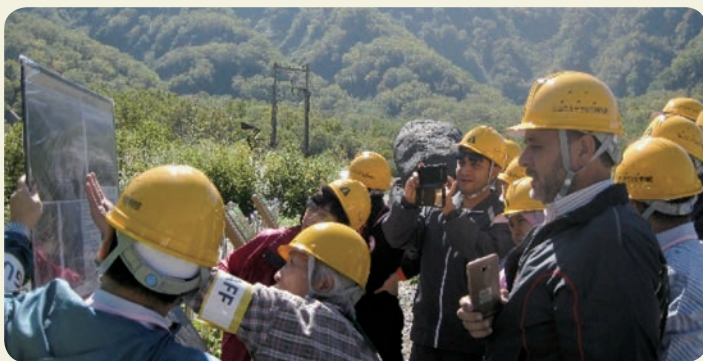
インタープリバントのエキスカレーターでの立山砂防事業の見学