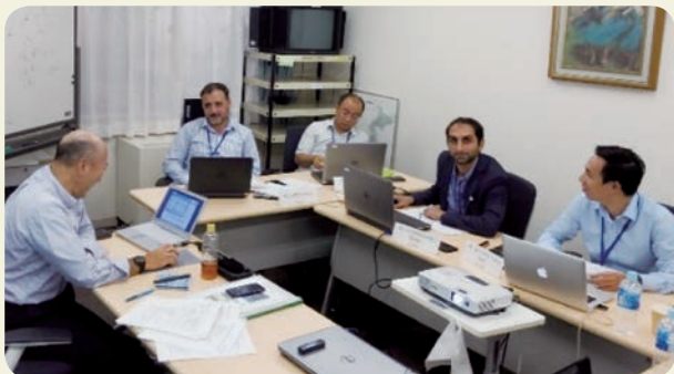
構造物対策グループの砂防施設設計演習

更に、同時期に富山で開催された当該分野の国際シンポジウム「インタープリメント2018 In 富山」に参加し、日本国内外の新たな知識・