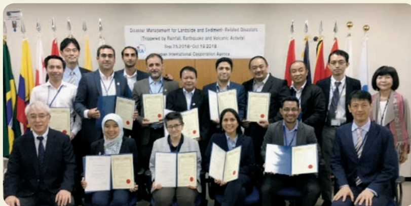
研修修了証書とインタープリバント参加証を無事手にした閉校式

加え、福山市の堂々川砂溜群のような「ローコスト工法」の事例見学の組み込み、予算や人材不足に対応できる手段として民間資金の活用やNGOとの協働の事例、また観光促進等他産業と組み合わせた砂防施設の整備や、住民による砂防施設の維持作業の事例見学などです。現実的な取り組みに必要な技術知識と考えられるため、ぜひ組み込んでいきたいと考えています。