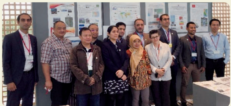
自らが作成展示したポスターを前に