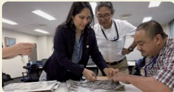
非構造物対策グループの段ボールジオラマワークショップ