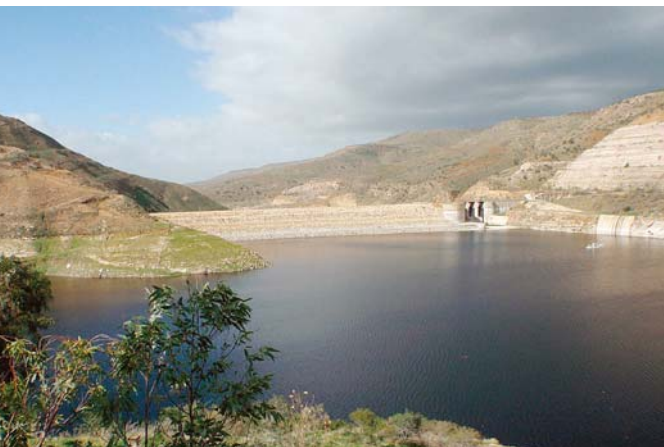
写真-10 KING TALAL DAMの全景。ダム堆砂が進行したため、竣工10年後に嵩上げしている