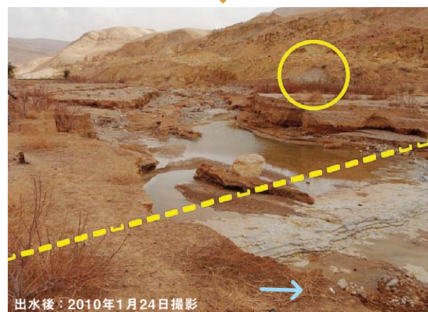
写真-7 MUJIB DAM上流の貯砂ダム計画地点(黄点線がダム軸)。上が設計当初(2009年)の状況、下が2010年1月18日の出水直後の状況。河床が基盤岩まで侵食されているのがわかる