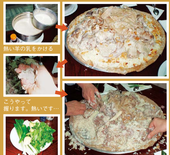
熱い羊の乳をかける

ジャミードと呼ばれる羊の乳から作ったヨーグルトで羊肉を柔らかくなるまで煮込み、その煮込み汁で米を炊き、炊きあがったライスの上に柔らかく煮た羊肉とナッツを乗せて、最後にまた熱いジャミードをかけて出来上がり。そして、“右手”で羊肉とライスを混ぜながらおにぎりのように握って食べます。