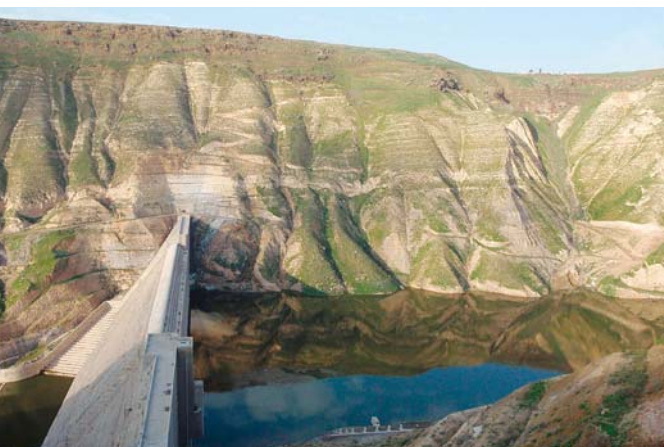
写真-9 WEHDAH DAMの全景。右岸側の高地はシリア。河道の中心がヨルダン-シリアの国境