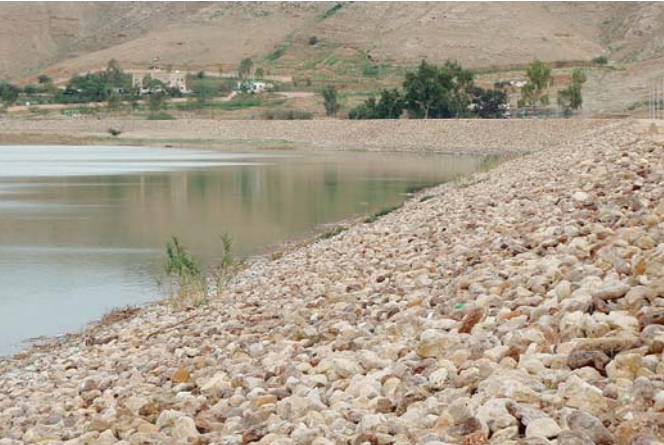
写真-8 SHEIB DAMの天端。10基のダムの内、6基がロックフィルダムである