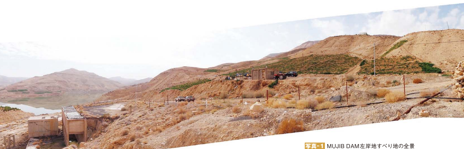
写真-1 MUJIB DAM左岸地すべり地の全景