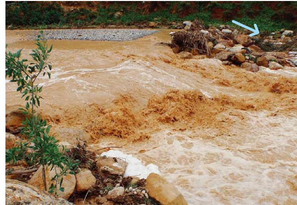
写真-6 KING TALAL DAM上流にある空石積みダム地点の2010年1月18日の出水状況

今回の指導により、ひずみ計の制作・設置および観測はC/Pだけで十分に実施できるレベルまで達することができた写真-4ことから、今後は、C/Pが伸縮計とひずみ計、ダム湖水位の観測等によってすべり面を特定し、必要に応じて対策工を実施するよう指導した。