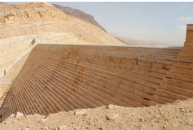
写真-11 TANNUR DAMの全景。堆砂は進行していないが、右岸袖部の岩盤に漏水が発生している