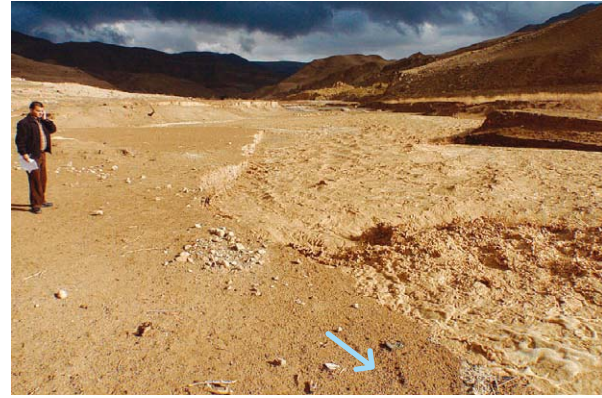
写真-5 MUJIB DAM上流の2010年1月18日の出水状況。上流では雨が降っているが、本地点は晴れている。(左: MUJIB DAM Nidal所長)